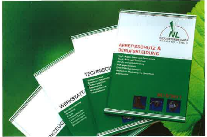
Klar gegliedert: Vier jährlich erscheinende Kataloge präsentieren das umfangreiche Sortiment von Niemann-Laes