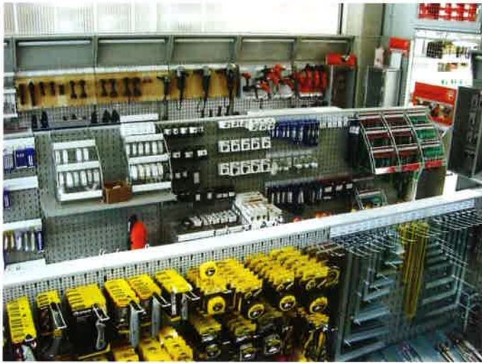
Einblick in einen Verkaufsraum von Niemann-Laes